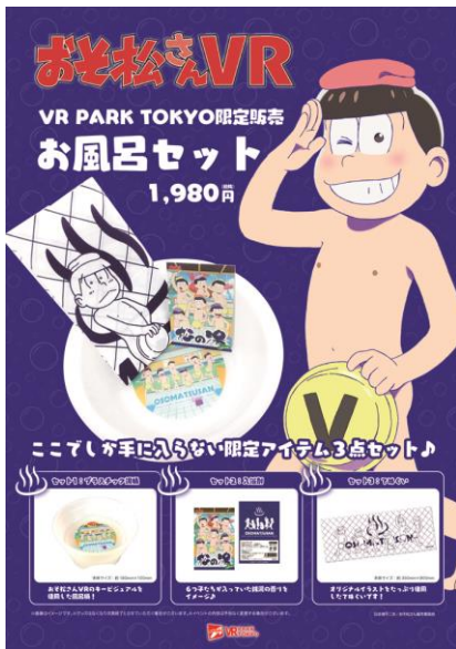
①プラスチック湯桶